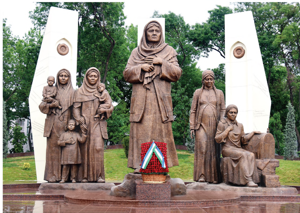
Ўзбекистон Республикаси Президенти Матбуот хизмати суратлари.